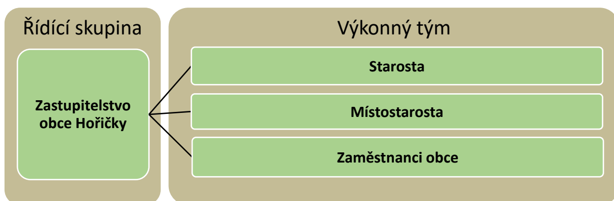
Schéma 1 Znárodnění systému řízení a organizačního zajištění naplňování PRO Hoříčky na období let 2020–2025

Efektivní naplňování strategického plánu může být obecně zajištěno jedině díky jednoznačnému systému řízení. Platí to i pro tento rozvojový plánovací dokument. Jedná se tedy o zajištění postupného naplňování stanovené vize, strategických cílů, opatření a aktivit. Pro tyto účely byly stanoveny následující dvě hierarchické úrovně systému řízení a organizačního zajištění naplňování PRO (viz schéma 3).